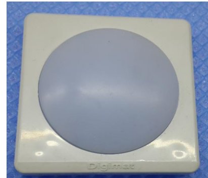
Şekil 4:Ürün hazırdır.