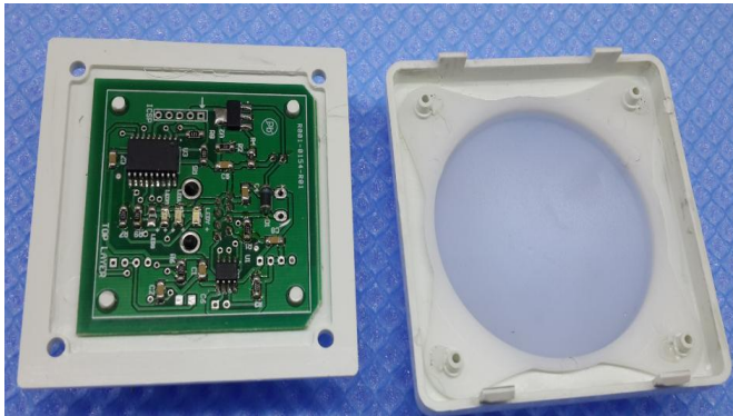
Şekil 3: Arka kapak ile ön kapağın yan yana görüntüsü.(RND 11- RND 06)