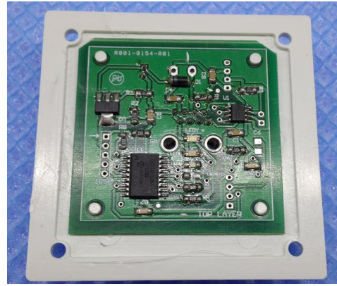
Şekil2: PCB Kartın yerleştirilmiş hali.