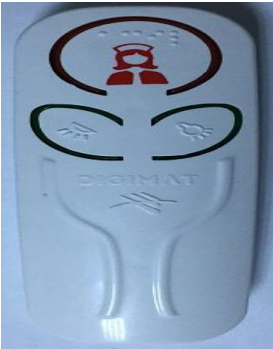
Şekil 2: Elseti üst kapak görüntüsü.