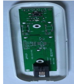
Şekil 4: Elseti alt kapağına PCB kart yerleştirilir.