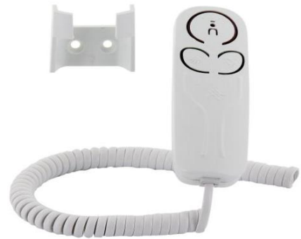
Şekil 7: Ürün teste hazırdır.