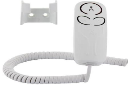
Şekil 1: Elseti çağrı ünitesi.

Hastanın yatakbaşı çağrı ünitesini kullanmadığı durumlarda yatağından kalkmadan rahatlıkla çağrı işlemini başlatabileceği hemşire çağrı sistemi parçasıdır.