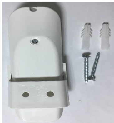
Şekil 6: Tutturma aparatı dübel ve vidayla sabitlenir.