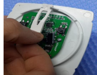
Şekil 1: PCB kartı ön yüzü görünümü.