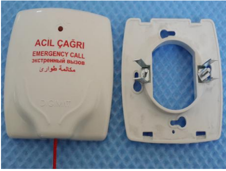
Şekil 9: Monte etmek amaçlı metal tırnaklı kapak eklenir.