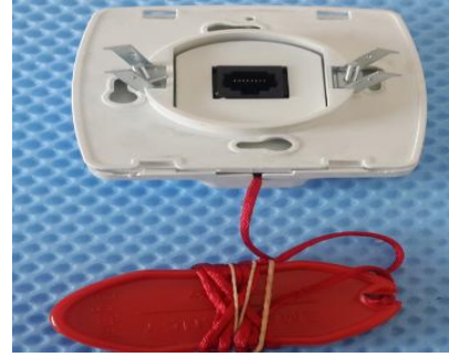
Şekil 10: Cihazın arka kapak takılmış görüntüsü.