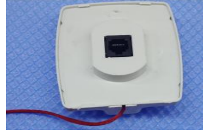
Şekil 8: Ürün teste hazırdır.