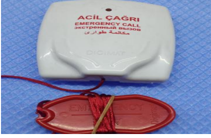
Şekil 7: Ürünün arka kapak görüntüsü.