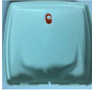
Şekil 5: Cihaz üst kapağı.