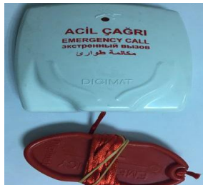
Şekil 8: Cihaz teste hazırdır.