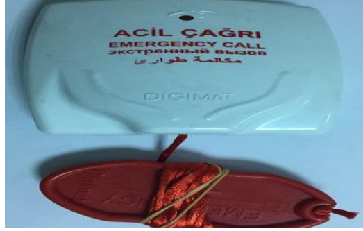
Şekil 1: Wc-Banyo Çağrı Ünitesi.

Hasta odaları ya da koridorlardaki wc-banyolardan hemşire veya personel desteği için butonla ya da ipli tutamak ile çağrı yapılmasını ve iptal edilmesini sağlar.