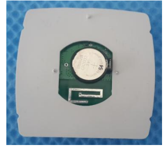
Şekil 6: Cihazın arka yüzü.