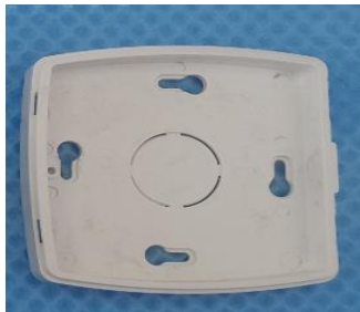
Şekil 7: Askı aparatı görüntüsü.