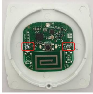
Şekil 2: PCB kartı vidalanır.