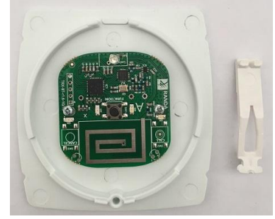
Şekil 3: İp takılması için aparat eklenir.