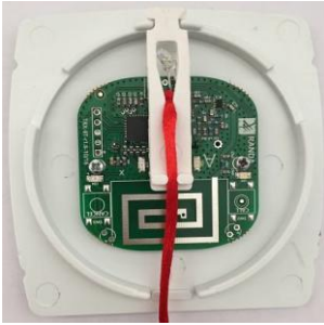
Şekil 4: İp yerleştirilir.